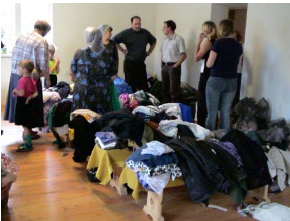
Hjelpesendingen ble sortert, og delt ut til flere familier..