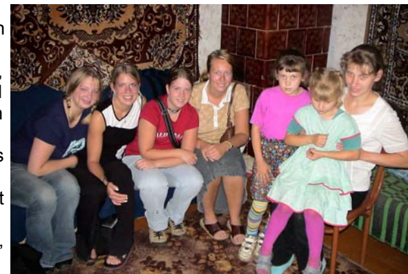
På besøk hos en familie med 2 jenter. Moren ble rørt til tårer når vi kom med en sekk klær til dem.

opplevelse å være med på dette arbeidet. Spesielt da en av familiene vi besøkte ble rørt til tårer. Kveldsmøte var organisert p.g.a. vårt besøk i landsbyen. Vi måtte sitte framme med møtelederen og se utover forsamlingen. Det var møtt opp dobbelt så mange som det pleier på møte. Vi jenter sang og Vidar holdt en sterk tale om Himmelriket.