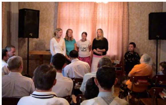
Vi deltok på møte i Smyrna menigheten på søndag formiddag

Vi ønsker å rette en takk til "Arbeid i Lviv". Vi vil også si takk til alle andre som har vært med og bidratt med tid, midler og bønner. Vi hadde aldri klart oss uten dere!