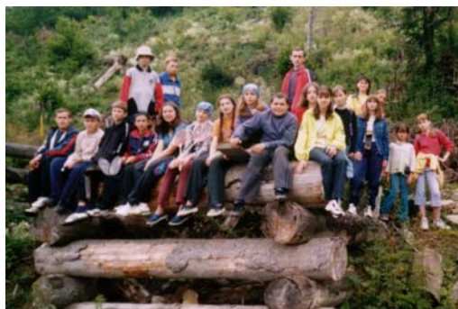
Fra barneleiren i fjor.

Det jobbes nå med å videreføre arbeidet som er gjort i forbindelse med sommerleirene. Og en ting de tenker på er å starte brevskole for barn i alderen 7-14 år. Hvor en også håper på å nå foreldrene igjennom dette, ved at de også leser igjennom kurset.