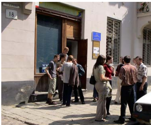
Utenfor klubben, som låner lokaler i sentrum av Lviv.

Når teamet fra Norge var i Lviv var de på besøk i denne klubben. De fikk veldig god kontakt med ungdommene her. Og fikk være med å vitne om Jesus for flere av ungdommene som ikke kommer fra noen kristen sammenheng.