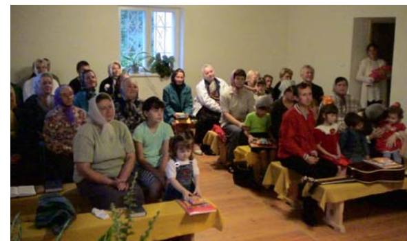
Fra møtet i utposten Bibrka