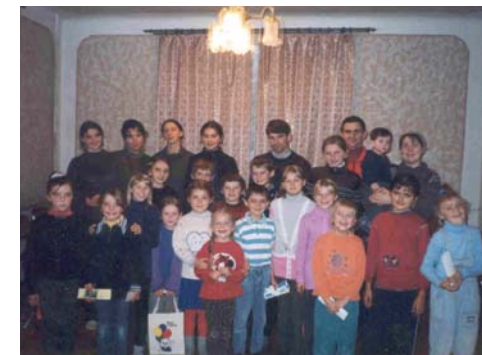
Noen av barna i barneklubben "Awana".

Vi venter mer informasjon og bilder fra sommerleiren i år, men har ikke mottatt dette. Vi vil komme tilbake med mer informasjon og bilder fra denne leiren senere.